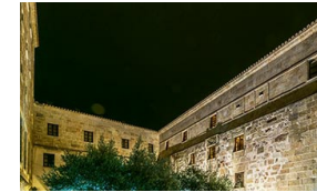
Cinco palacios 5 estrellas para dormir por menos de 100 €