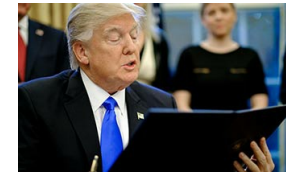
Una juez bloquea de forma temporal las deportaciones por el veto de Trump