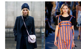
Azul y naranja: ¿Cómo los combino?