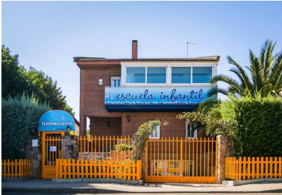
Escuelas infantiles como Nemomarlin aplican en sus modelos educativos la Teoría de las Inteligencias Múltiples de Howard Gardner.

En tiempos lejanos la inteligencia se medía en términos de masa encefálica: cuanto más grande era la cabeza, mayor se presuponía. Hoy se sabe que existen hasta ocho tipos de inteligencia y ya hay algunos métodos educativos para niños que contemplan dicha variedad intelectual. Elegir una buena escuela infantil para nuestros hijos no es tarea fácil. La edad comprendida entre los 0 y los 3 años será vital para el desarrollo de los más pequeños, por lo que la educación y los estímulos que reciban del exterior durante esta etapa serán condicionantes en su crecimiento y en la manera que tienen de descubrir el mundo.